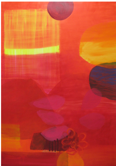
Grazyna Gotz: Passage 2011 Olie på lærred