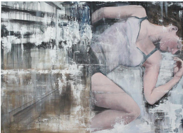
Thomas Kolding: Double Landscape Olie på lærred