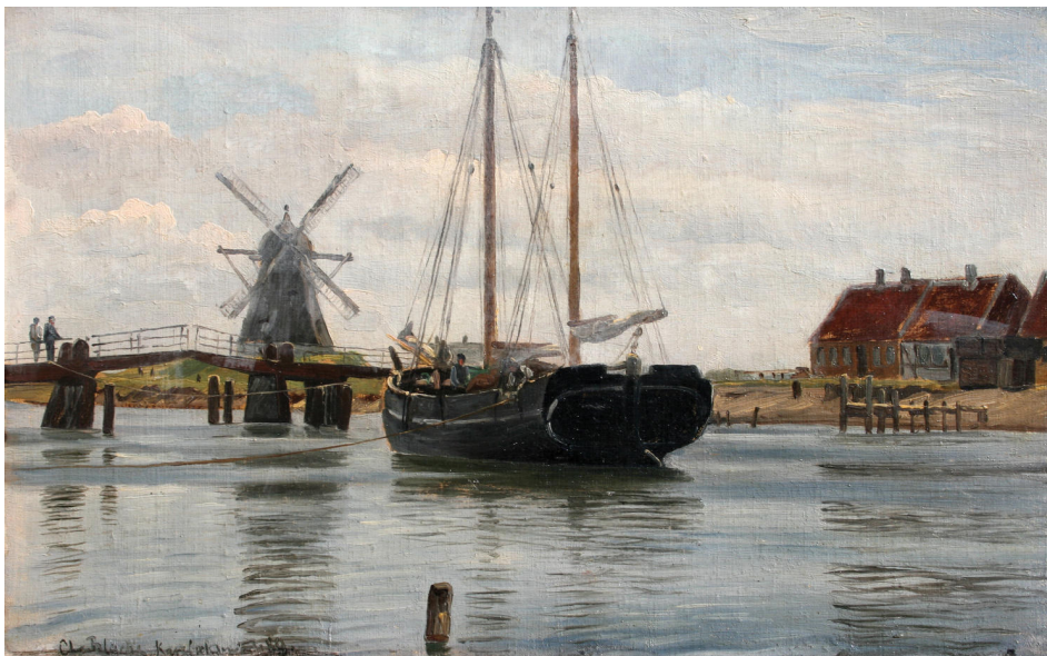
Chr. Blache: Kanalen i Karrebæksminde (privat eje)

For at projektet med at formidle historien om Næstved Havn og Ladeplads kunne lykkes, var det nødvendigt, at nogen troede på, at det var en god idé. Heldigvis syntes Næstved Havns bestyrelse, at en udstilling af malerier med malernes meget forskellige tolkninger af motiver fra bl.a. havnens besiddelser kunne være et spændende islæt i festliggørelsen af havnens 75 års jubilæum. De valgte at støtte udstillingen, og hermed blev det muligt at samle værkerne, formidle deres indhold og sammensætte en vifte af arrangementer, hvor formidlingen af historien sættes i centrum.