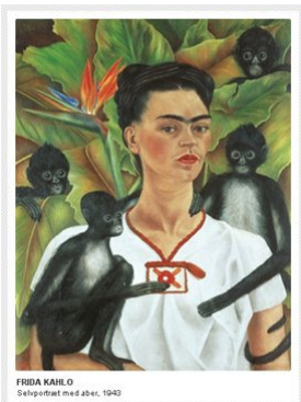
Selvportræt med aber, 1943