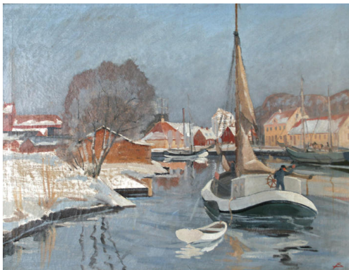
Albert Svendsen: Susåen i Næstved (Næstved Kommune)

Under det forberedende arbejde til maleriudstillingen fandt vi hurtigt ud af, at vi gerne ville omsætte denne maleriudstilling med de forklarende tekster til en publikation, der fortæller historien om varetransporten mellem Næstved og ladepladsen ved Smålandshavet.