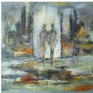
Inge Juul: Mod lyset