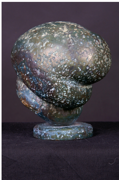
Knud Verner Knudsen: Menneskelig form, bronze

Fiberbetonskulpturerne er bygget over en kerne af expanderet polystyren - flamingoskum - og der er kun ca. 1 cm beton yderst. Det er et meget stærkt materiale og står ude i haven året rundt. De fleste af bronzeskulpturerne er støbt i sandform på et lokalt metalstøberi.