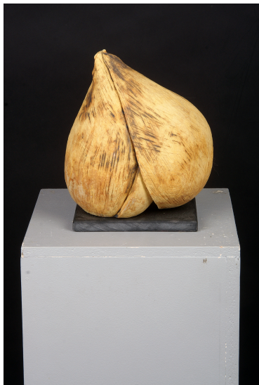
Knud Verner Knudsen: Løg, stentøj